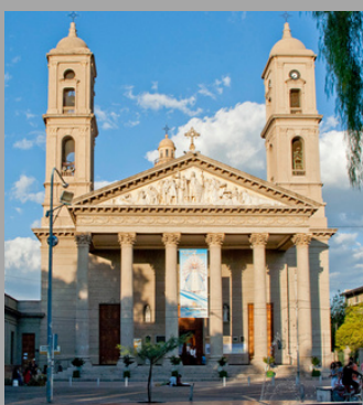
La Catedral (San Luis,Arg)