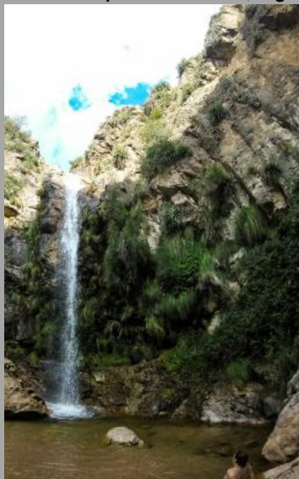
Villa Larca, Chorro San Ignacio (San Luis, Arg)