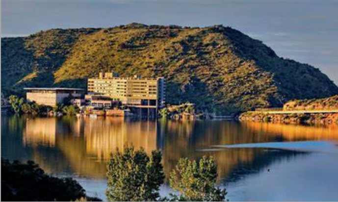
Potrero de los Funes (San Luis ,Arg)