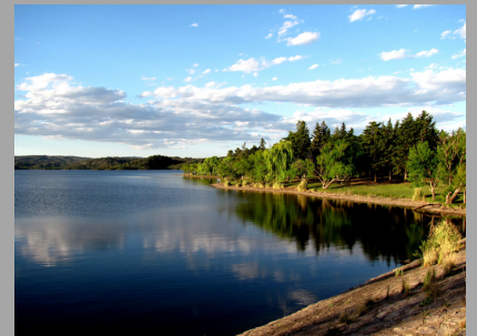
La Florida (San Luis ,Arg)