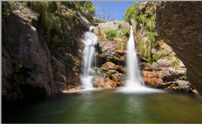
Villa Elena-Cortaderas (San Luis, Arg)