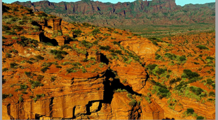
Parque Nac Sierras de las Quijadas (San Luis ,Arg)