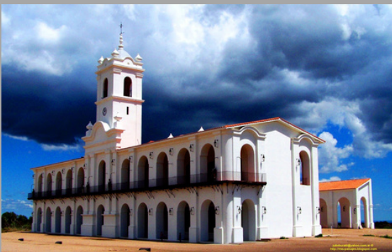
La Punta (San Luis , Arg)